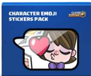
クラロワ ステッカー