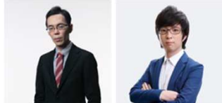
実況 eyes さん 解説 Revol さん