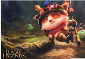
クリアファイル (全8種)