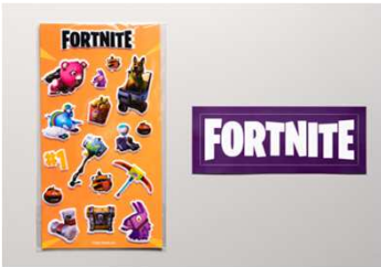
特製フォートナイトステッカー