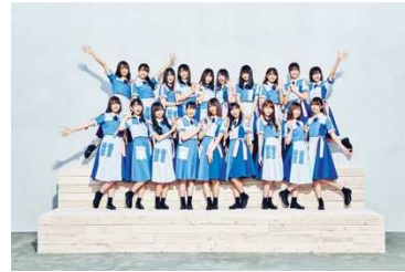
日向坂46 (参加メンバーは後日発表)

さらに決勝大会の実況・解説を、それぞれ第一線で活躍する以下のメンバーが担当することが決定いたしました。一流の実況・解説者たちが、全国屈指の高校生チームのスーパープレイを分かりやすくお伝えします。また、クラッシュ・ロワイヤルのゲーム配信で人気のきおきおさん、プロゲームチーム CRAZY Raccoonのメンバーも来場し、高校生の皆さんの熱い戦いを盛り上げます。